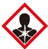
발암성·변이원성·생식독성· 전신독성·호흡기 과민성 물질 경고