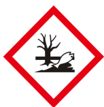
수생환경 유해성 경고